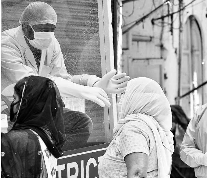
A health worker collects samples for a swab test at a mobile Covid-19 testing van in New Delhi

India had received 500,000 rapid antibody test kits from China last